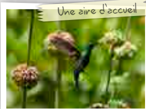
Une aire d'accueil

✳ Accueillir les oiseaux dans votre jardin en installant des haies refuges comme l'hibiscus ou l'atoumo qui possède également des propriétés médicinales.