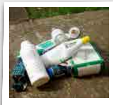
Emballages vides de produits phytosanitaires