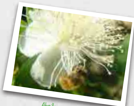
Abeille sur goyave