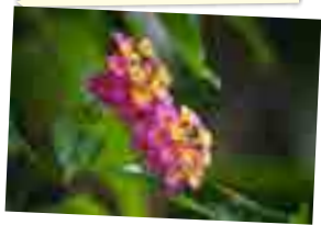
Des fleurs vagabondes

✳ Laisser l'herbe et les fleurs vagabondes esthétiques (héliconia, balisier,