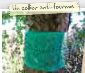
Un collier anti-fourmis

Par exemple, la coccinelle est le plus efficace auxiliaire de culture au service du jardinier amateur. Elle mange les pucerons qui sucent la sève des plantes du jardin, des fruits et des légumes du potager. Si le jardinier protège son jardin ou son potager en utilisant des pesticides, il tuera la coccinelle, et les pucerons recommenceront ailleurs ce qu'ils ne pourront plus faire ici.